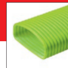
Half rond kanaal