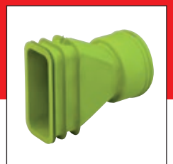
Koppelstuk rond/half rond